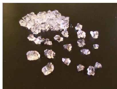
Grains PERLE D'EAU gonflés d'eau

PERLE D'EAU a la propriété de restituer très facilement l'eau et les substances nutritives absorbées en fonction de la demande des plantes. Cette propriété permet aux plantes de disposer en permanence et à volonté d'eau et de substances nutritives en fonction des cycles de gonflement et de restitution d'eau des grains de PERLE D'EAU .