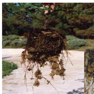
Racines avec grains de PERLE D'EAU gonflés d'eau

PERLE D'EAU a la propriété de restituer très facilement l'eau et les substances nutritives absorbées en fonction de la demande des plantes. Cette propriété permet aux plantes de disposer en permanence et à volonté d'eau et de substances nutritives en fonction des cycles de gonflement et de restitution d'eau des grains de PERLE D'EAU .